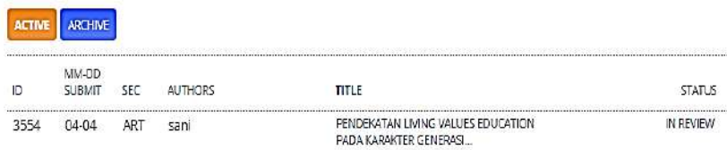
Gambar. Status In Review

Tahap 3: Ini merupakan tahapan terakhir setelah melalui tahap revisi maka artikel sudah dipublikasi pada jurnal tersebut sehingga dapat berguna atau dapat di baca oleh setiap orang yang mengunjungi template jurnal tersebut, di mana status pada in review tadi berubah menjadi Published atau Archived . Setiap jurnal memiliki terbitan pada bulan tertentu tetapi bila diperlu pembuktian untuk sesuatu