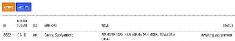
Gambar. Status Awaiting Assignment

Tahap 2: Pada tahapan ini status akan berubah menjadi In Review di mana artikel anda sudah dilihat oleh editor serta akan segera di periksa bila ada revisi maka akan dikirimkan pemberituannya melalui email yang tercantum saat mendaftar pada jurnal tersebut.